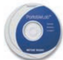
Le HelloCD™ CD-ROM

Sous réserve de modifications techniques. © 06/2003 Mettler-Toledo GmbH Imprimé en Suisse 51724225A