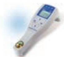
Refracto 30GS réfractomètre portable haute gamme

Les appareils de la série PortableLab™ couvrent une énorme gamme d'applications, grâce à des modules interchangeables (X-mate Pro ) et aux fonctions de calcul et de conversion très souples (Densito/Refracto): oxygène, pH, degrés Brix, indice de réfraction, concentration d'alcool, salinité, densité du moût, etc.