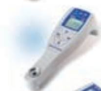
Refracto 30PX réfractomètre portable