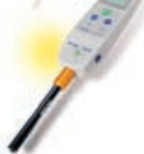
X-mate Pro pH-mètre/multimètre