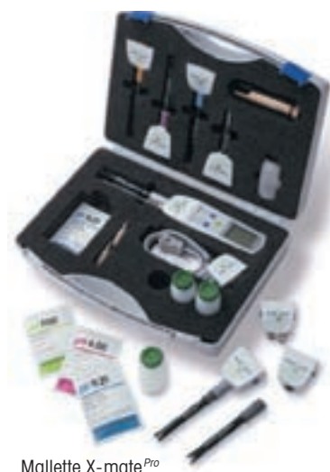
Mallette X-mate Pro