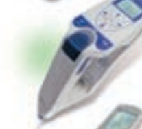
Densito 30PX densimètre portable